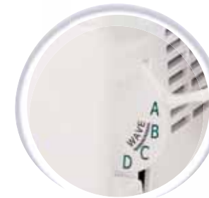
Selectie van de naad